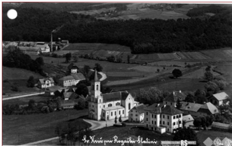
Slika 3: Desno od cerkve Sv. Križa je stala štirirazredna osnovna šola Sveti Križ. Fotografija datira na prva desetletja 20. stoletja.