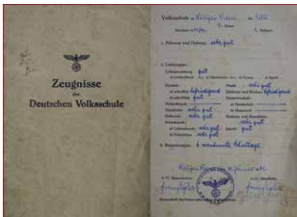
Slika 4: Izkaz iz nemške šole v Sv. Križu pri Rogaški Slatini – platnica in prva notranja stran.

Nemci so uničili vse, kar je bilo slovenskega. V šolo so uvedli nemški jezik in povsod prepovedali slovenskega, prav zato pa je bil pouk brez posebnega pomena, saj otroci nemškega jezika v večini niso poznali. 37