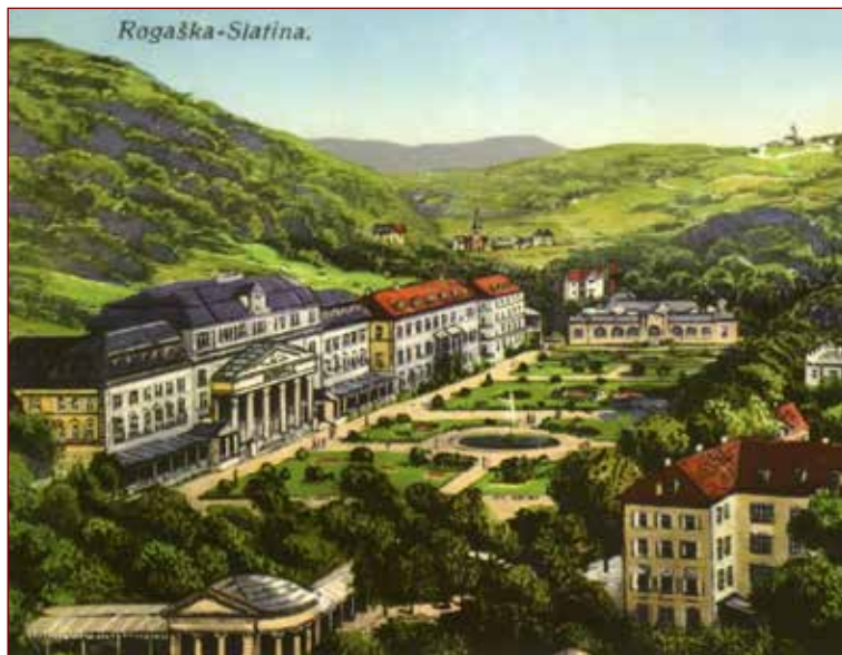
Slika 1: Fotografija zdravilišča 1914. V ozadju sta vidni cerkvi sv. Križa (levo spodaj) in sv. Trojice (desno na hribu).

vode čudežno ozdravel in obenem poskrbel za njen sloves. 17 Priljubljena svetokriška voda je že ob koncu 17. stoletja postala prava prodajna uspešnica. Podobno kot dvorni zdravnik so tudi mnogi drugi zdravniki na Dunaju in drugod po cesarstvu začeli predpisovati svojim pacientom različne pitne kure (terapije pitja mineralne vode). 18