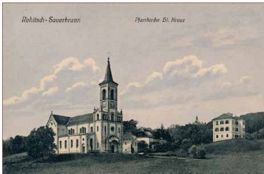
Slika 2: Desno od cerkve Sv. Križa je stala šola Sveti Križ. Fotografija/ razglednica je nastala konec 19. stoletja oz. v začetku 20. stoletja.

Glede dohodka je takrat učitelju več prinašala cerkvena kakor pa šolska služba. Za vsakega učenca je dobil 48 kr. konvencijskega denarja. Pomožnega učitelja si je moral sam plačevati. Učiteljev je bilo kar nekaj. Od leta 1828 je skoraj 40 let pri Svetem Križu poučeval Mihael Hoisel.