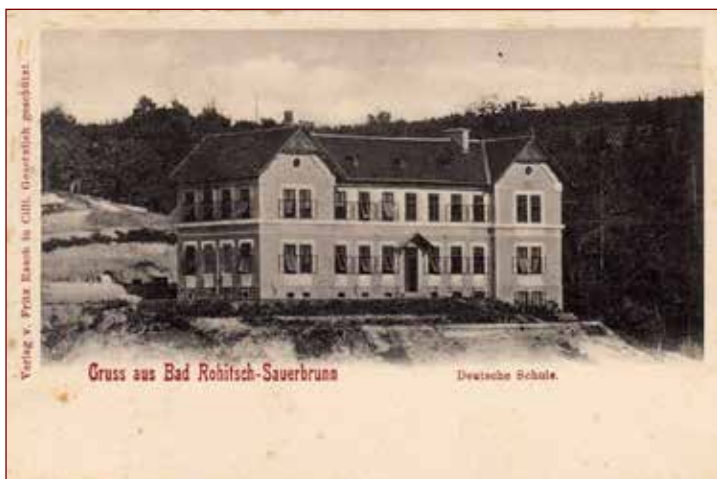
Slika 6: Razglednica »Nemške šole« oz. Deutsche schule, šole »na hribčku«. Fotografija datira na prelom 19. in 20. stoletja.