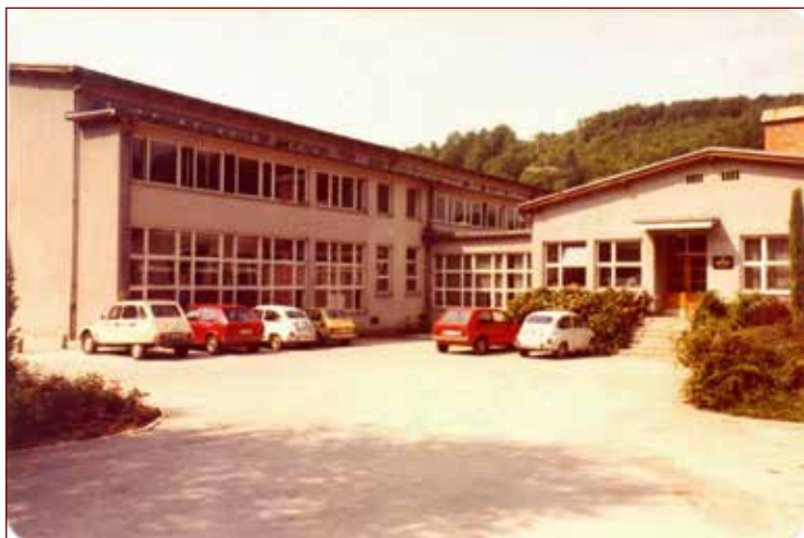
Slika 10: JVIŽ I. OŠ Rogaška Slatina (marec 1981).

Po otvoritvi nove centralne OŠ Borisa Kidriča ni več delovala šola pri Sv. Križu, kasneje so jo porušili.