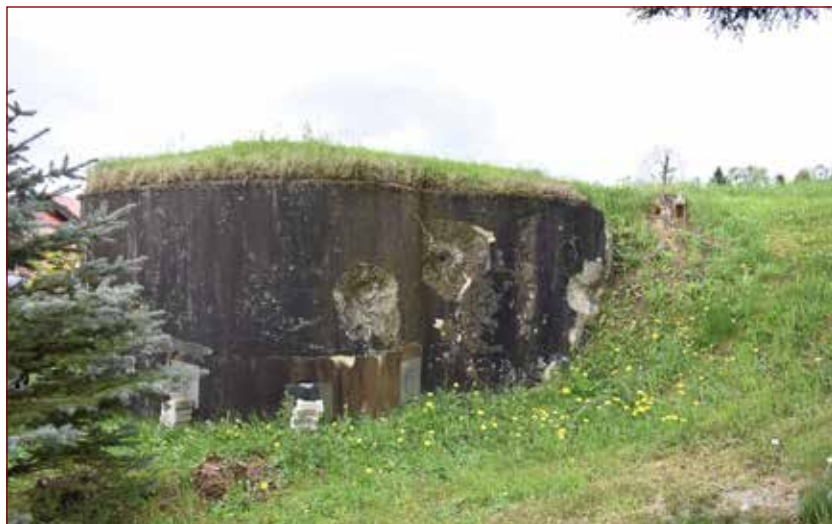
Slika: Bunker v Šentilju.

Ob 6.30 (dne, 6. 4. 1941) so se začeli prvi spopadi pri Šentilju.