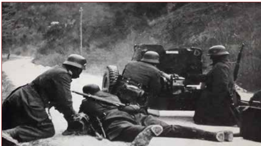
Slika: Nemci streljajo na bunker pod cerkvijo Sv. Barbare. 55

Samo v nekaj dneh so Nemci zasedli vso Koroško, jugoslovanska vojska se je umikala na obrambne položaje.