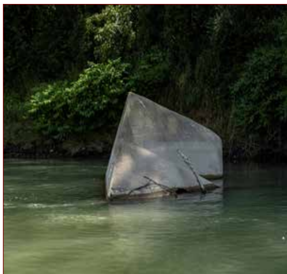
Slika: Prevrnjen bunker v Dravi.

prostor, zato je bil razdeljen na posamezne odseke, pododseke, rajone, in sicer proti Nemčiji z zahodnim odsekom (z zahodnim in vzhodnim pododsekom) in vzhodnim odsekom (z zahodnim – dravskim, srednjim – murskim in vzhodnim – prekmurskim pododsekom).