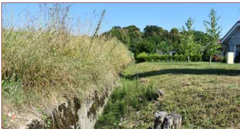
Slika: Delno zasipan protitankovski jarek v Podvincih.

Napad nemških sil se je pričakoval pri Libeličah in Viču ter naprej proti Dravogradu, kjer je potekala cesta in železnica. Na Kozjaku je bil prehod možen na Duhu na Ostrem vrhu, Remšniku in Kapli. Po prečkanju meje bi nemška vojska krenila proti Dravogradu po Mežiški dolini, skozi Ravne, Črno, Šoštanj, Velenje, Celje in naprej proti Zagrebu in po dravski dolini proti Mariboru in naprej. Rajon od Pesnice po Slovenskih goricah do Mure je potekal po precej lažje dostopnem terenu. Napad bi se skoncentriral na mejna prehoda Sv. Jurij in Šentilj, kjer je potekala tudi železnica, in se nadaljeval do Maribora in naprej proti Zagrebu.