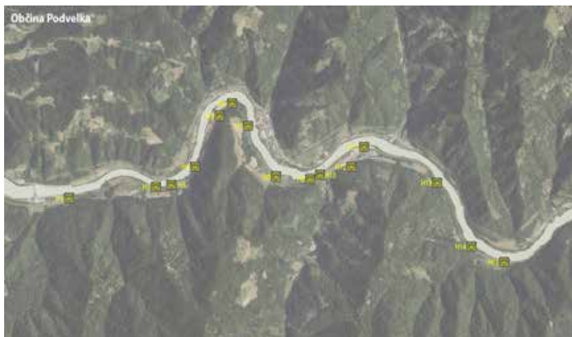
Slika: Fortifikacije v občini Podvelka.