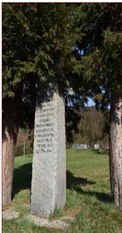
Slika: Spomenik padlim ob začetku vojne.

Pred močnimi skupinami napadalcev so se umaknili na pobočja Pohorja. Na bojišču je obležalo 23 hrabrih branilcev Dravograda oz. naše domovine. Njim v čast danes v Dravogradu stoji tudi edini spomenik, ki nas spominja, da se boji niso odvijali le v času 'narodnoosvobodilnega boja, ampak 'tudi 'prej.