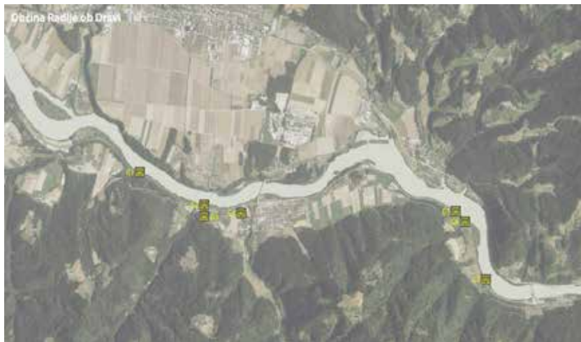
Slika: Fortifikacije v občini Radlje ob Dravi.

ostati na svojih položajih, še posebej na mejnih prehodih. Nato naj bi se postopoma umikali do posadkovnih enot in skupaj odbijali sovražnika. Pridružili bi se jim tudi orožniki. Prvi udarni val so pričakovali skozi Dravograd.