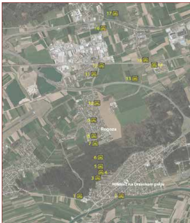
Slika: Fortifikacije med Rogozo in Miklavžem na Dravskem polju.

Na možen napad nemške vojske je bil pripravljen obrambni položaj, ki se je začel pri Črni na Koroškem, se nadaljeval v smeri vzhoda do Mežiške doline, Prevalj, Raven do Dravograda, se nadaljeval ob reki Dravi do Ruš, Bezene, Bistrice ob Dravi, Laznice, Limbuša, Peker, Radvanja, Razvanja, Bohove, Hoč, Rogoze in vse do Miklavža na Dravskem polju. Začelo se je utrjevanje v globino.