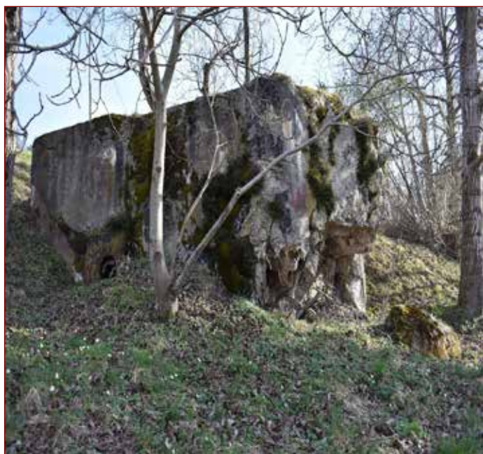
Slika: Bunker v Dravogradu.

Mariboru, na Ptuju in na Muri v Gornji Radgoni, na Tratah, v Radencih in v Veržeju. Nemški vojski so v veliki meri pomagali tudi pripadniki nemške manjšine in njeni simpatizerji. Ker jih je bilo veliko, naj bi te kraje napadali z manj artilerije in letalstva, da bi bilo civilnih žrtev čim manj. 50 Nemške enote so Kraljevino Jugoslavijo napadle na cvetno nedeljo, 6. aprila 1941. Na severni fronti so prekoračili mejo pri Radljah, Remšniku, Duhu na Ostrem vrhu, pri Juriju, Špičniku, Plaču, Svečini, Šentilju, Tratah, Gornji Radgoni, Gederovcih, pri Cankovi ... Zjutraj so nemška letala preletela Dravograd, ki je bil za napad vojaško nepripravljen.