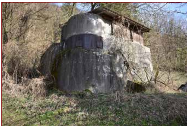
Slika: Vernikov bunker, Dravograd.

cev. Ta dan boji še niso dosegli prave ostrine. Branilci so z vzpetine nad železniško postajo uspešno obstreljevali levi breg Drave in Črneško polje, rezervisti na Dobravi so Nemcem onemogočali, da bi prodrli proti glavni bunkerjev obrambne linije, dohod Nemcev iz Mežiške doline so varovali topovi s Kronske gore, ki so obstreljevali tudi 'nemške 'položaje 'pred 'Dravogradom. V noči na 8. april so Nemci prešli reko Dravo prek delno porušenega železniškega mostu v neposredno bližino bunkerjev. Zelo so se tudi približali rezervistom na Dobravi. Ti so po nekajurnem boju položaje zapustili in se umaknili proti Slovenj Gradcu. Dobravo so tako zasegli Nemci in z močnim bočnim ognjem začeli obstreljevati bunkerje, ki so že tako bili pod ognjem iz Dravograda. Iz Mislinjske doline se je ta dan umaknila glavna vojska, kmalu za njimi so se tudi iz bunkerjev ob Dravi umaknili preostali vojaki. Na obrambnih položajih so tako ostali le še graničarji in orožniki. Na ta dan so bili boji hudi in obe strani sta imeli nekaj mrtvih in ranjenih.