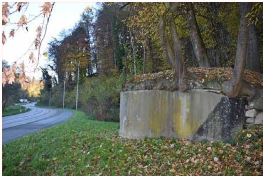
Slika: Bunker v Podgradu pri Gornji Radgoni.

7.25 uri sta bila mostova čez Muro pri Cmureku in Gornji Radgoni že v nemških rokah. 56