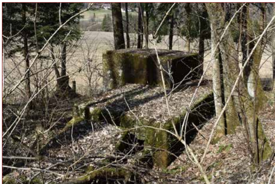
Slika: Bunker na Poljani.

Koroškem, ali proti vzhodu do Prevalj. Tukaj je vodila tudi pomembna železniška proga, ki je do Prevalj tekla skozi dva železniška predora. V Holmcu so nemški vojaki napadli graničarje in tri tudi ubili. Z artilerijo so obstreljevali okolico vhoda v bližnji železniški predor, ki so ga stražili jugoslovanski vojaki. Ti so se zaradi obstreljevanja umaknili s položajev, pred tem pa razstrelili oba predora. Nemški vojaki so napredovali čez mejo in se ustavili na vzpetinah, s katerih so lahko opazovali Poljane. 53 Tam je jugoslovanska vojska postavila več bunkerjev. Štirje so bili postavljeni tako, da so pokrivali cesto iz Holmca in so lahko z gostim navzkrižnim ognjem pokrivali vse dostope do doline. Nemci so z eno artilerijsko baterijo obstreljevali z razdalje 3 km jugoslovanski položaj na Poljani. Veliko jugoslovanskih vojakov je zbežalo na vzpetine nad Poljano, predvsem proti Lešam ... Tako je bila obramba na Poljani, katere priprava je trajala dve leti, razbita. 54