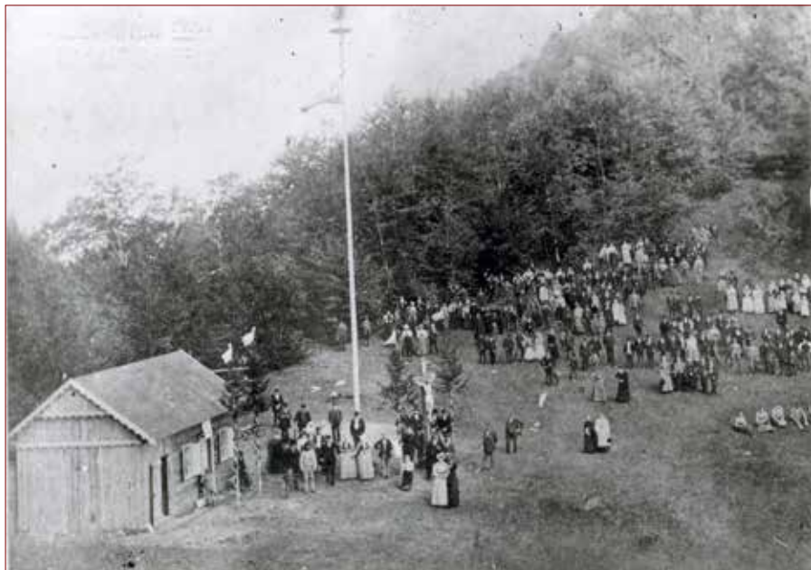
Slika 2: Otvoritev Hausenbichlerjeve koče na Mrzlici, 28. september 1899. 43

Ob pol dvanajstih je kaplan Medvešček iz Griž blagoslovil kočo in križ 44 ob njej. Združeni žalski in gotoveljski pevci so potem zapeli »Lepa naša domovina«. 45 Po pevskem nastopu je zbrane nagovoril načelnik gradbenega odbora Anton Petriček: