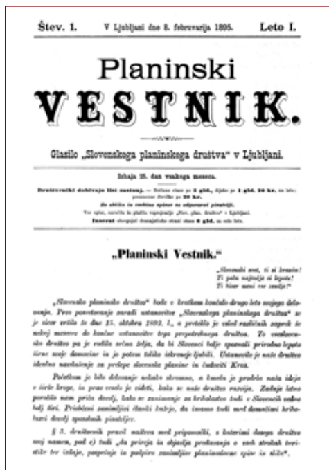
Slika 1: Naslovnica prve številke Planinskega vestnika , 8. februarja 1895.

Kot velik napredek nam je zabeležiti izdajo društvenega glasila "Planinskega Vestnika«, ki ga dobivajo člani zastonj. Ni nam treba biti žal velikih stroškov, ki jih povzroča list, ako vpoštevamo uspeh in ugled, katerega si je društvo pridobilo z njim. S "Plan. Vestnikom« smo vzbudili še večje zanimanje za društvo in privabili marsikaterega novega člana in sotrudnika« so zapisali 25. marca 1896. 19