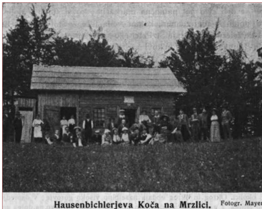
Slika 3: Hausenbichlerjeva koča na Mrzlici. 68

Celjski odsek podružnice je v letu 1913 med drugim markiral pota iz Žalca na Mrzlico skozi Griže in z Mrzlice v Št. Pavel pri Preboldu. V Hausenbichlerjevi koči je priredil planinsko veselico, ki se jo je udeležilo 60 oseb. Poleg tega je »zbujal in razširjeval /.../ zanimanje in veselje do turisticke. 67