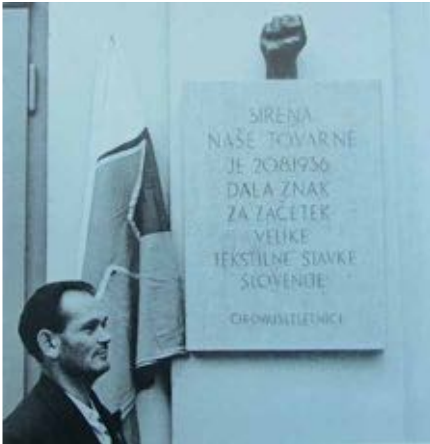
Slika 1: Spominska plošča stavki v Iskri ob odkritju. 45

razgovoru so se delavci spominjali tistih dogodkov. Iz njihovih resnih obrazov je odseval ponos in zadovoljstvo. 44