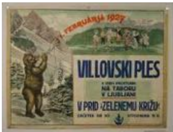
Slika 1: VII. Lovski ples v vseh prostorih na Taboru v Ljubljani, v prid »Zelenemu križu«, 1. februar 1927.

Predstavljeni plakati so vezani na današnje ozemlje Republike Slovenije, nastali pa so med letoma 1910 in 1960. Gre za turistične plakate, ki promovirajo naravne lepote, letovišča in zdravilišča, ter prireditvene plakate, ki oglašujejo kulturne in športne prireditve, sejme, kongrese in srečanja različnih interesnih skupin. Posebna skupina so plakati iz serije komercialnih reklamnih plakatov za različne izdelke.