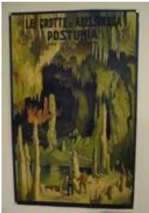
Slika 2: Franz Lenhart, 1898–1992: Le Grotte di Adelsberga. Postumia ore 2.30 da Trieste, post 1920.

Številni razstavljeni plakati odsevajo politično in družbeno dogajanje v tem obdobju. Napisi na plakatih so v različnih jezikih – v srbsčini in hrvaščini, pa tudi v nemščini, italijanščini in francoščini. Posebej zanimiv je primer reklamnih plakatov za Postojnsko jamo oz. Postojno, ki je po podpisu Rapalske pogodbe leta 1920 prešla izpod Avstro-Ogrske pod Kraljevino Italijo. Zapisana je v različicah Adelsberg, Postoina in Postumia. Postojnsko jamo pa so vse do konca italijanske oblasti nazivali s Postumia Grotte.